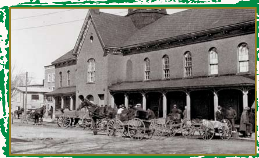
Le marché public d'Acton Vale a permis aux agriculteurs, à compter de 1862, d'écouler les produits de leur ferme.

Destinée d'abord à assurer l'auto-suffisance de la famille, la ferme comprenait un poulailler, quelques cochons, des moutons, un petit troupeau de vaches et, quelques fois, un bœuf. Le potager procurait de la nourriture fraîche en été et permettait de faire des provisions de légumineuses, de pommes de terre, d'oignons, de choux, de carottes et de navets pour l'hiver. La cueillette des petits fruits et la chasse permettaient de varier le menu.